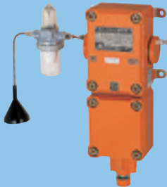
吸引式检测部 PE-2DC (d2G4)