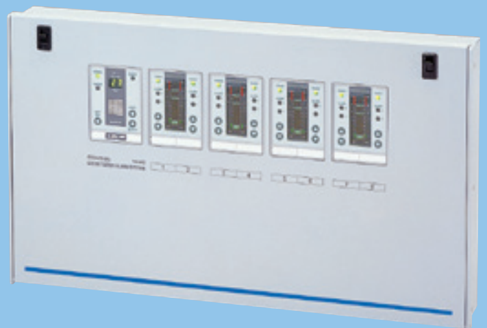
报警指示部 照片是8点式。 除此之外还有2·4·6·10·12点式。