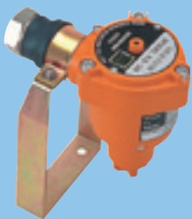
扩散式检测部 KD-5 (d2G4)