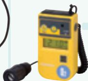
▲ XO-326 II sB (1m 电缆线)