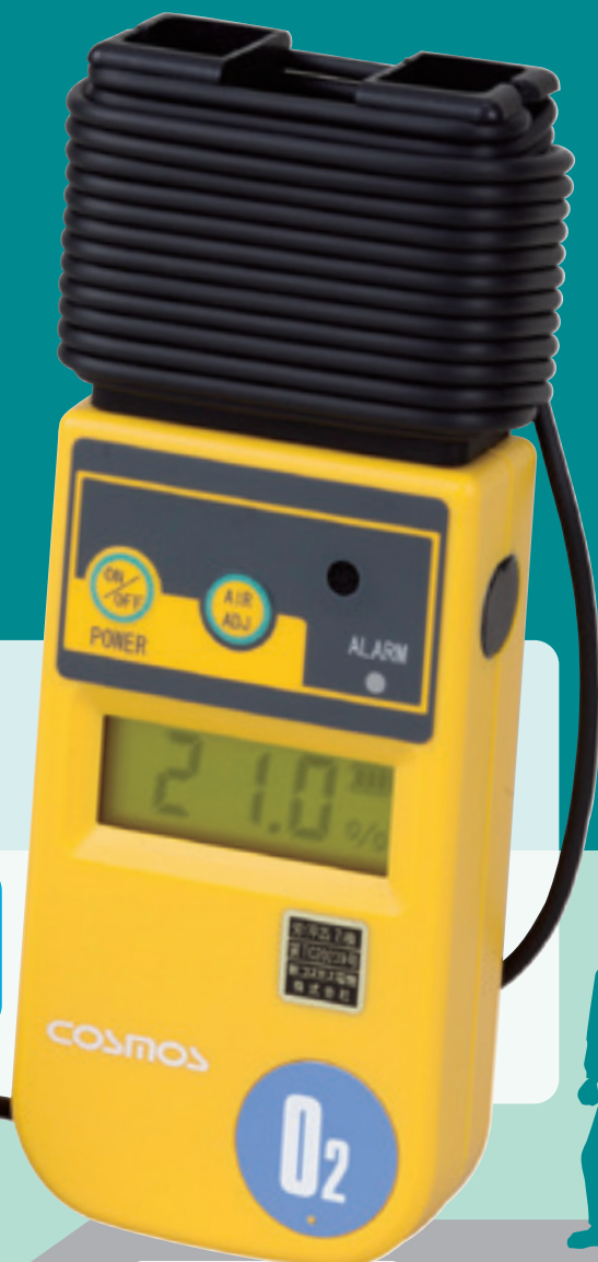
▲ XO-326 II sA (5m 电缆线)