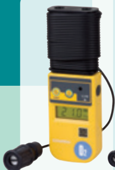
▲ XO-326 II sC (10m 电缆线)