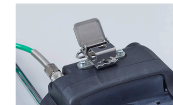
鳄鱼夹 [ST-20] 可夹在皮带上使用。