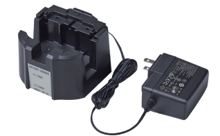
充电器 [BC-10] 给镍氢充电电池充电。另外，即使机器内没有电池也可以通过AC电源供电。