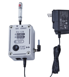
通气测试仪 [EG-129] 与机器连接后，通气点检。