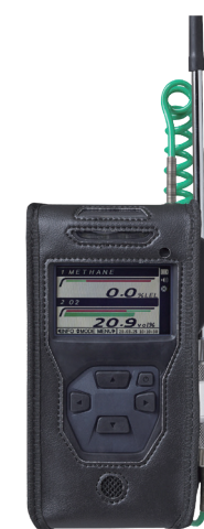
皮套 [C-37] 保护机器 免受污染和损伤。